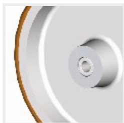
96G...vs s kluzným ložiskem