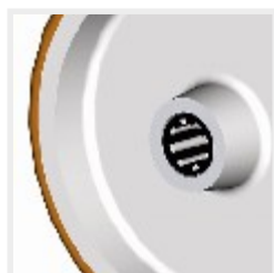
97R...vs s válečkovým ložiskem